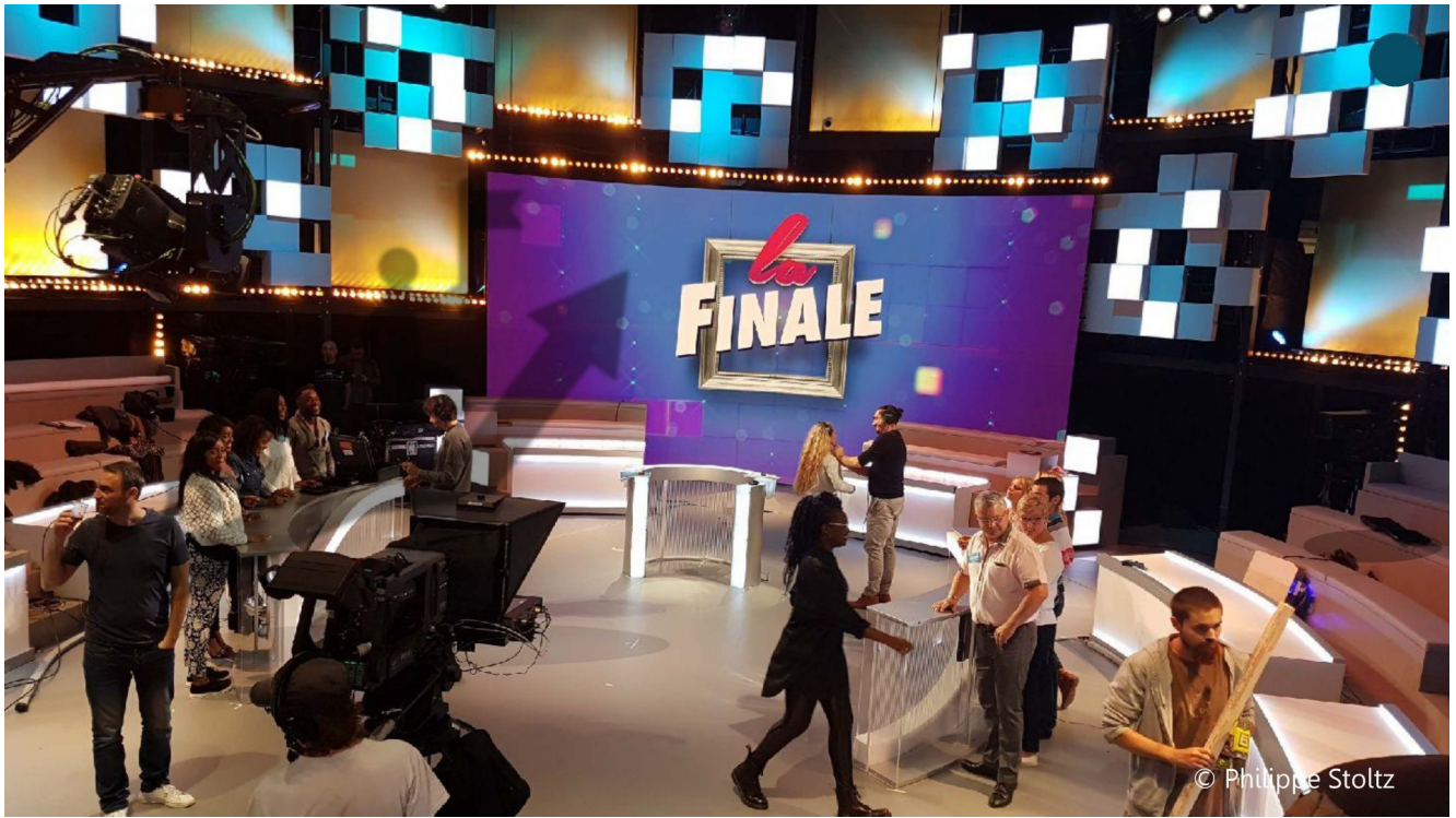
Produire une émission de flux pour la télé